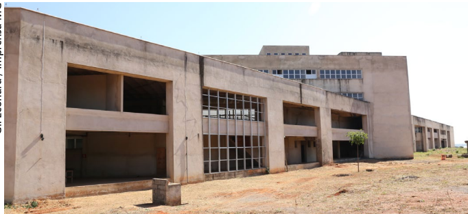
Hospital Regional de Sete Lagoas