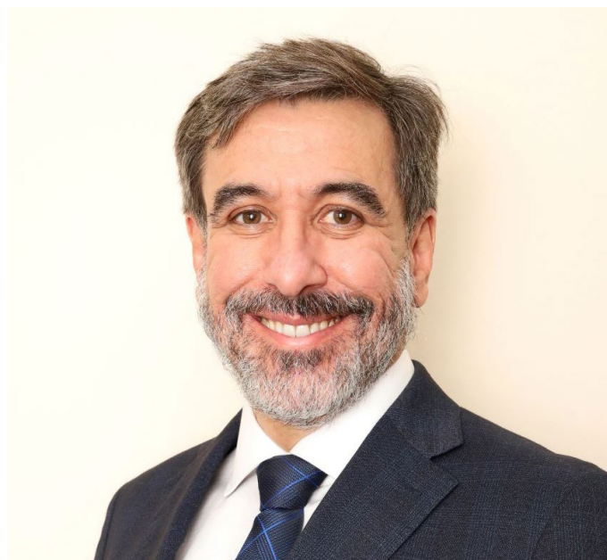
Adriana Porto / Apeminas

Unificação - Mas, com a unificação das Procuradorias, em 11 de julho de 2003, e a criação da Advocacia-Geral do Estado, todos esses procuradores do Estado e da Fazenda Estadual passa-