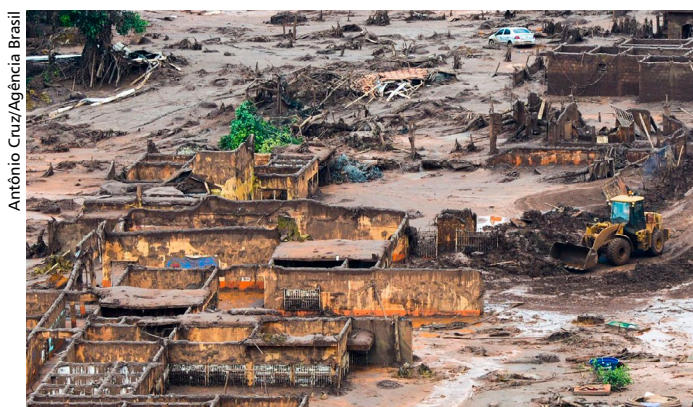
Antônio Cruz/Agência Brasil

(Com informações do Ministério Público Federal e Agência Minas )