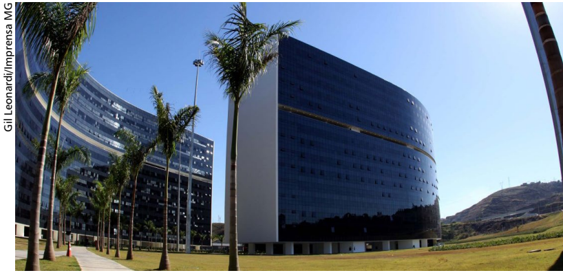
Gil Leonardi/Imprensa MG