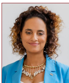
Governo de SP

Para ter acesso à matéria, siga este link .