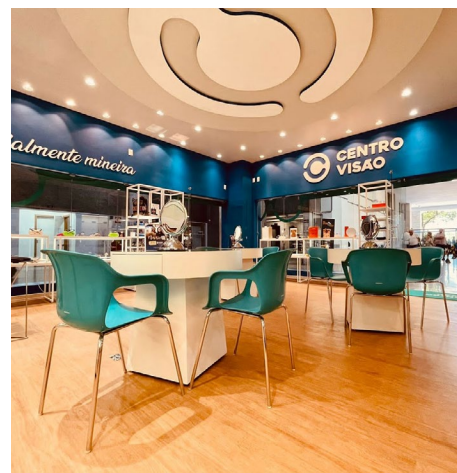
Divulgação/Centro Visão Cruzeiro

O acesso ao benefício está condicionado à apresentação de comprovante de identificação de associado da Apeminas e/ou comprovação de parentesco em linha direta ascendente ou descendente.