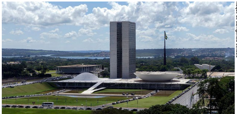
Roque de Sá/Agência Senado

Entre as metas, destaca-se a aprovação da PEC 82/2007 , que atribui autonomia funcional e prerrogativas aos membros da Defensoria Pública, Advocacia da União, Procuradoria da Fazenda Nacional, Procuradoria-Geral Federal, Procuradoria das autarquias e às Procuradorias dos Estados, do Distrito Federal e dos Municípios.